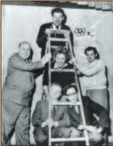
Münchner Lach- und Schießgesellschaft 1956

Sommer 1945: Der Faschismus ist besiegt, Deutschland besetzt. In den Trümmern des tausendjährigen Reiches nehmen Kabarett- und Kleinkunsth Bühnen den 1944 eingestellten Spielbetrieb umgehend wieder auf und genießen die wiedergewonnene Freiheit unter alliierter Aufsicht. Zeitkritik und politische Satire, in der Kabarettgeschichte bis dahin eher Ausnahme als Regel, werden in den folgenden zwei Jahrzehnten zum Markenzeichen. Das politisch-satirische Ensemblekabarett prägt die fünfziger und sechziger Jahre.