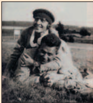
Gussy Holl und Kurt Tucholsky, 1921

Der Kaiser hat abgedankt. Deutschland versucht sich an der Demokratie – und die mündig gewordenen Kabaretts an der politischen Satire. Eine Zensur findet offiziell nicht mehr statt, plötzlich scheint möglich, was vormem undenkbar war: die kritische Kommentierung der politischen Ereignisse, das Lächerlichmachen der politischen Figuren. Mit seismographischem Gespür für die Geburtsfehler der Weimarer Republik formulieren zu Beginn eines unruhigen Jahrzehnts das zweite Schall und Rauch , Trude Hesterbergs Wilde Bühne und Rosa Valettis Cabaret Größenwahn ihren gesungenen und gespielten Protest gegen die reaktio-